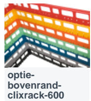
optie- bovenrand- clixrack-600