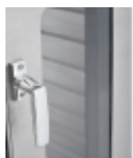
optie- isolatiecontainer- glazen-deur