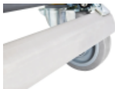
optie- isolatiecontainer- ergonomische- centrale-rem