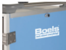
optie- isolatiecontainer- logo